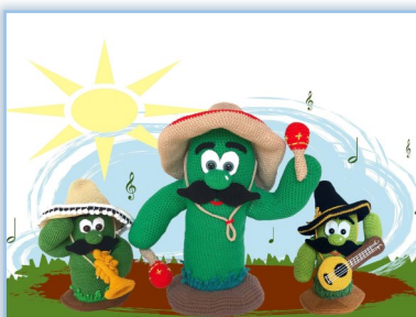
Wild Life XXL - Mariachi Band