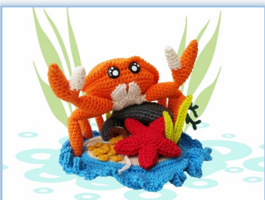
Under the sea - Karl Krabbe