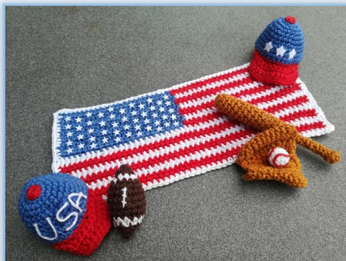
American Sports Accessoires